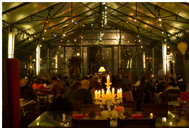
La salle de Bal - vue intérieure