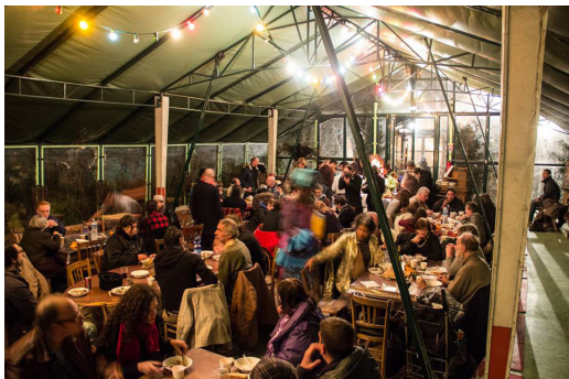
Le repas dans la Salle de Bal, 2013