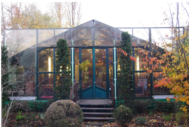
La salle de Bal - vue extérieure

Dans ce cas, appelez-nous au plus tôt au 01 47 24 51 24 afin de conjuguer nos énergies pour accueillir vos bénéficiaires.