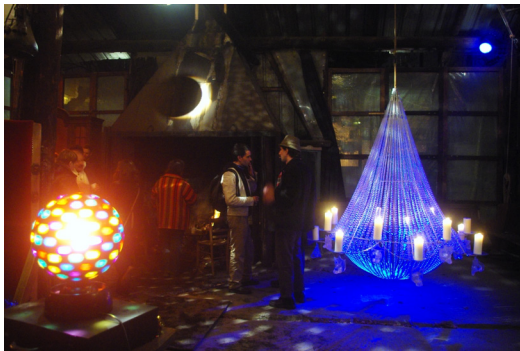
Le Favela, début de soirée, 2013