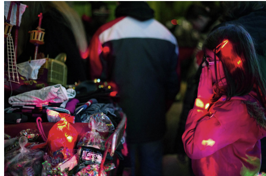
Distribution des cadeaux, 2016