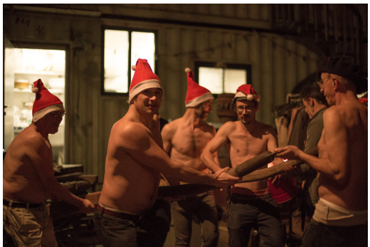
Distribution des cadeaux en traineau, 2016