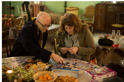
Fin de la soirée dans la Salle de Bal, 2016