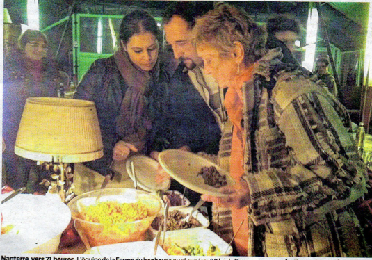
Nanterre, vers 21 heures. L'équipe de la Ferme du bonheur a pu récupérer 80 kg de légumes pour confectionner le repas. Un charcutier et un poissonnier ont aussi apporté leur aide.