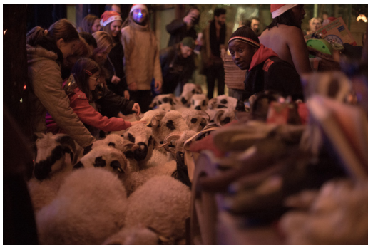
L'arrivée des moutons dans le Favela, 2016