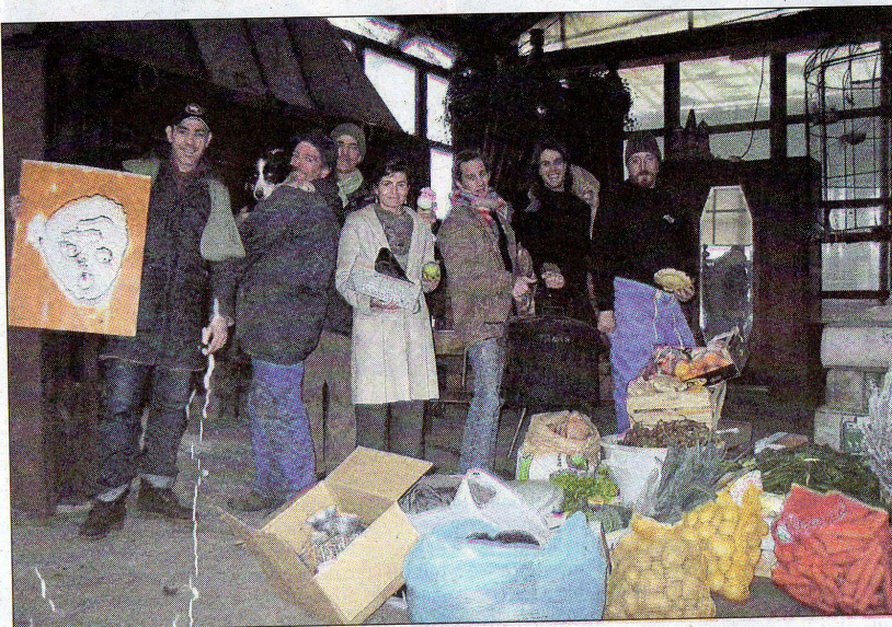
NANTERRE. A la Ferme du Bonheur, Noël sera à l'heure de la solidarité : on y dégustera ce que les moins défavorisés auront apporté. (L.P.)

La Ferme du Bonheur, 220, avenue de la République à Nanterre. Tél. 01.47.24.51.24. Courriel : la.ferme.du.bonheur@free.fr.